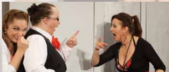
Fotó: Száguldó Orfeum

A darab, öt pénztárosnő, hat egymást követő reggelének eseményeit követi egy bank személyzeti társalgójában.